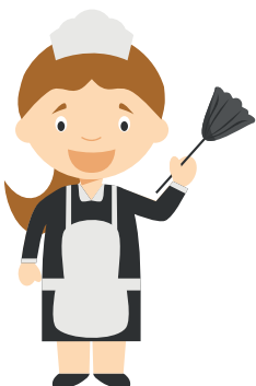
femme de ménage